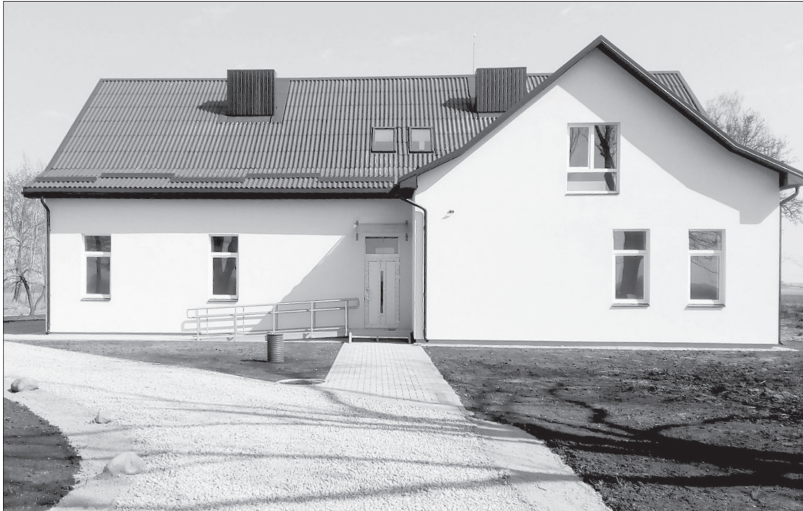
► Seno dvaro griuvena virto savarankiško gyvenimo namais

Viena tokių aktyvių bendruomenių - Gudkaimio - gyvuoja Vilkaviškio r. savivaldybėje, prie pat valstybės sienos su Kaliningrado sritimi, sodų apsupty. Savivaldybėje ji žinoma darbščiais žmonėmis ir jų darbais. Ir tuo, kad įgyvendinti tuos darbus pinigų užsidirba patys. Dirba kaip atsakingoje šeimoje - nori turėti - mąstyti ir stenkitis.