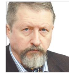
Audrius BUTKEVIČIUS Nepriklausomybės Atkūrimo Akto signataras

je nesutarė su Tarybų Sąjunga prieš vokiečius. Bet jis nurodė dėl ko, nes kategoriškai tokiems susitarimams prieštaravo Lenkija, Lietuva, Latvija ir Estija. Paskutinis skyriaus sakiny - „aš nežinau, kaip būtų pakrypusi istorija, bet žinau, kad jeigu būtumėm nepaklausę jų ir sudarę šią sąjungą, tai istorija būtų buvusi tikrai ne blogesnė negu ji buvo iš tikrųjų“. Negaliu 100 proc. garantuoti autentiškumo, bet visas bendras tos knygos vaizdas rodo, kad prie tokios išvados galima prieti. Pasikartosiu, kad mes ne daug ką galime paveikti, mūsų saugumas priklauso nuo šių galios centrų galimo ar negalimo konflikto.